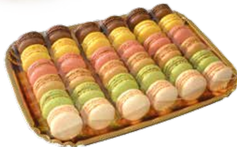
Plateau de macarons