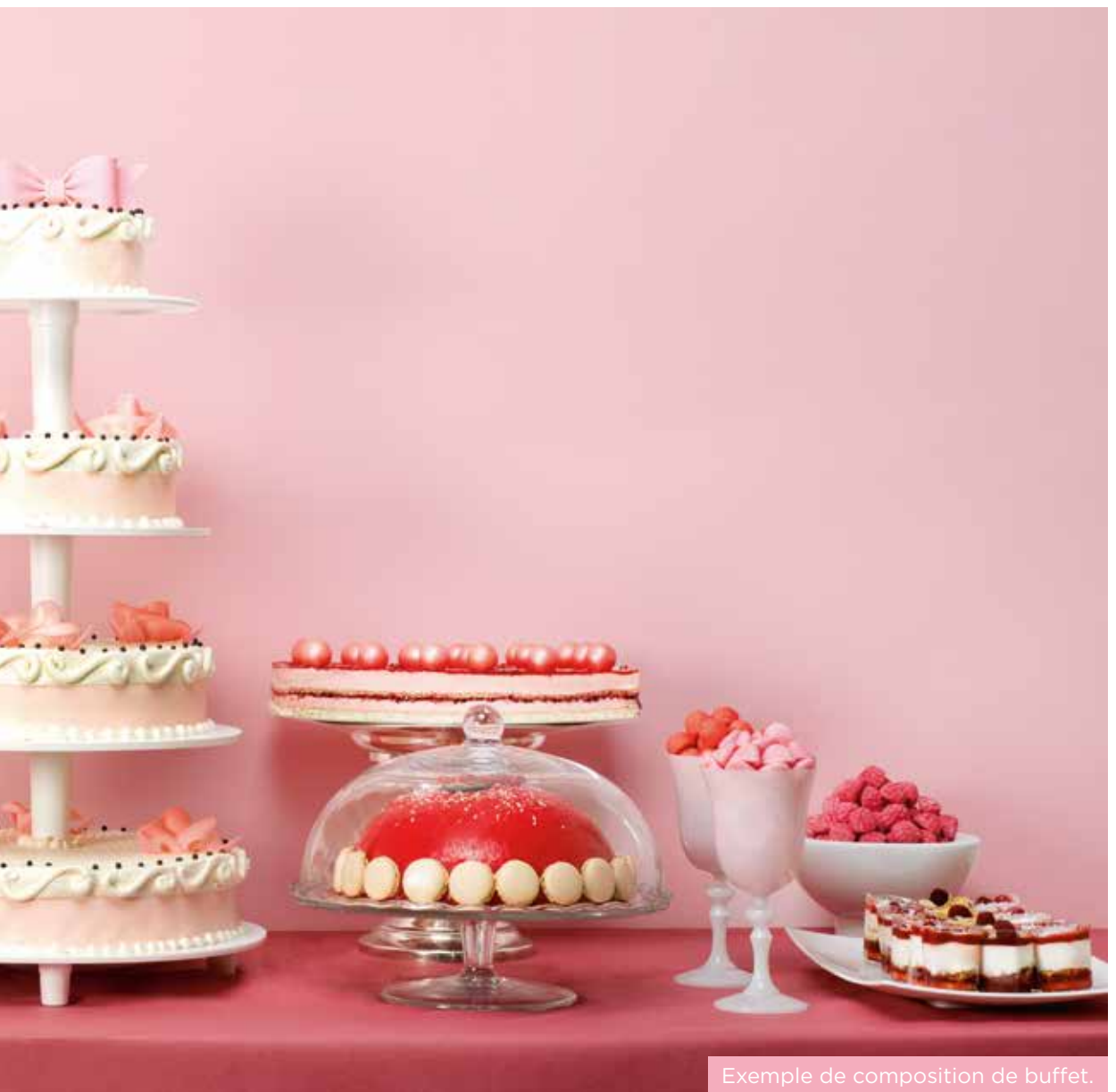
Exemple de composition de buffet.

Optez pour une cascade de desserts avec un présentoir sur plusieurs étages ou une pièce montée pour l'effet " Whaaouh ! "