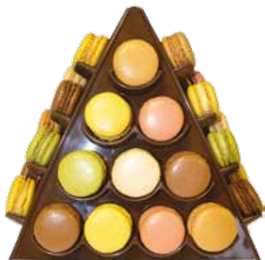
Pyramide de macarons