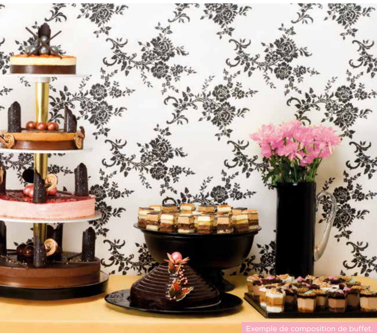
Exemple de composition de buffet.