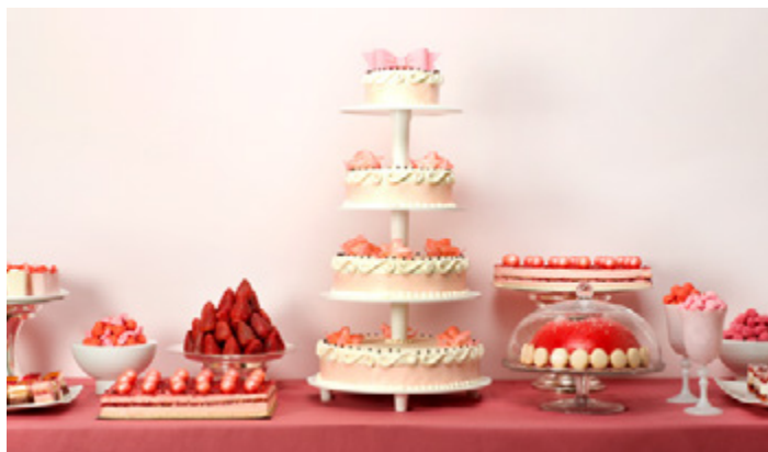
Pièces Montées Classiques et Buffet de Desserts

Pour vos fêtes et réceptions, découvrez notre collection complète de Pièces Montées en magasin ou sur www.laromainville.fr