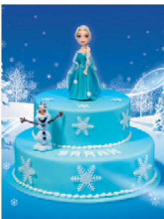
Pièce Montée Reine des Neiges*