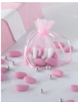
Dragées au kilo