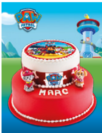
Pièce Montée Patrouille*