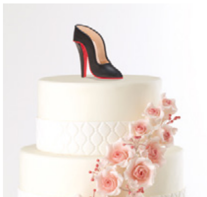
Décor en sucre