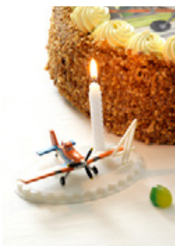
Bougie Anniversaire 33