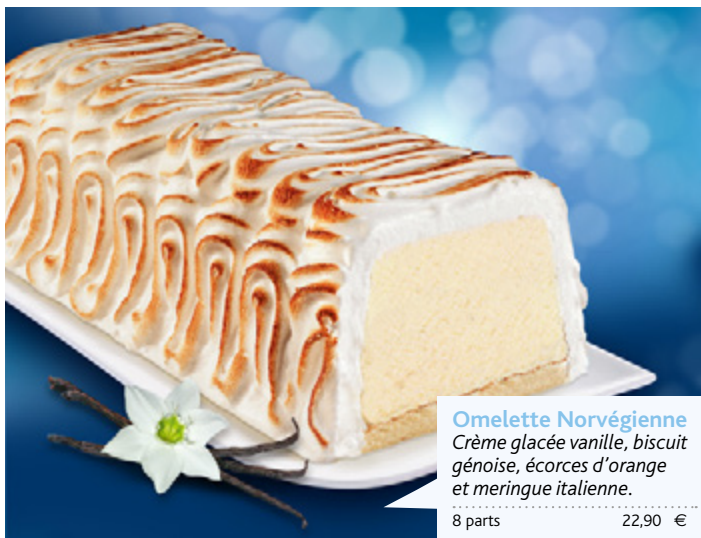
Omelette Norvégienne Crème glacée vanille, biscuit génois, écorces d'orange et meringue italienne.