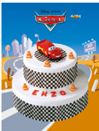
Pièce Montée Cars*