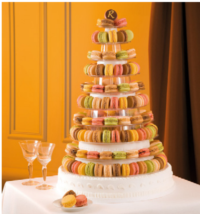
Pièce Montée Macarons