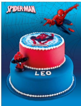
Pièce Montée Spider Man*