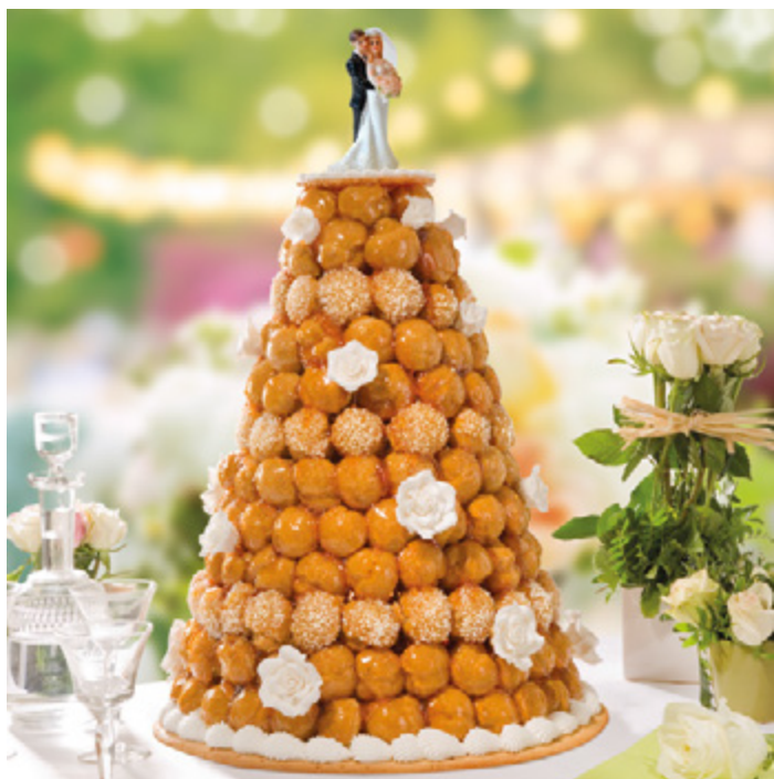
Pièces Montées Choux